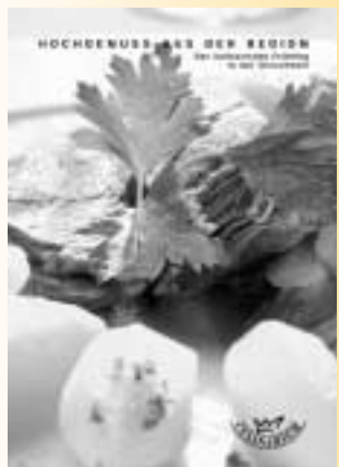
Klein, handlich und attraktiv: der neue Produkte- und Gastroführer

Der Trägerverein Culinarium hat verschiedene attraktive Werbemittel kreiert – wie Plakate, Speisekarten, Tischsteller oder den kleinen und handlichen Produkte- und Gastroführer «Hochgenuss aus der Region», der zum Thema «der kulinarische Frühling in der Ostschweiz» herausgekommen ist. Die Werbemittel können kostenlos bei der Geschäftsstelle des Trägervereins Culinarium, c/o Amt für Wirtschaft, Davidstr. 35, 9001 St. Gallen, Tel. 071 229 21 93 und E-Mail (info@culinariumnet.ch) bestellt werden.