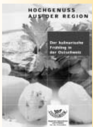
Der kulinarische Frühling in der Ostschweiz wird mit Plakaten propagiert

Appenzellerland abzuliefern. Die Erich Berner AG fährt mit Winter- und Frühlingsgemüse zu ihren Kunden. Die Ostschweiz habe beim Nüssli Salat viel zu bieten, ebenso bei Kartoffeln, Sellerie, Räben, rohem und gekochtem Rindfleisch, Karotten, Zwiebeln und vielem mehr, sagt der Gemüsehändler. «Besonders beliebt sind gelbe Rüebli», ergänzt er. Sie sind oft ein willkommener Farbtupfer im Menüplan.